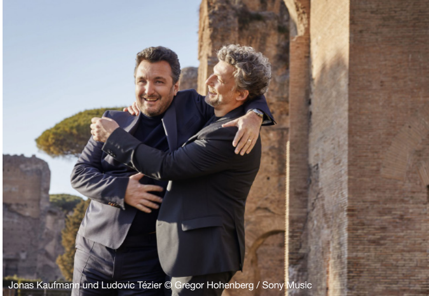
Jonas Kaufmann und Ludovic Tézier