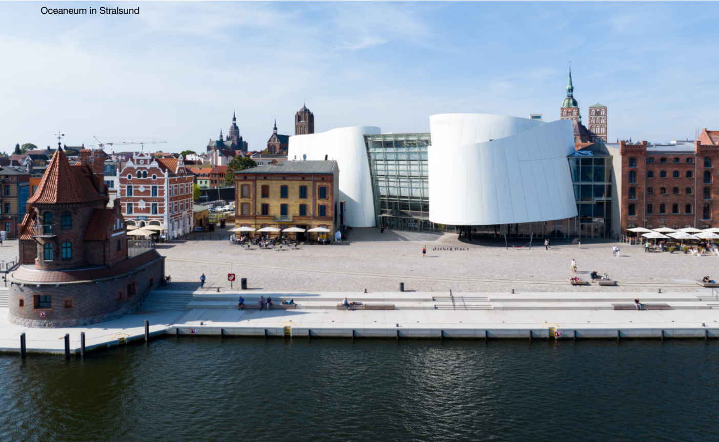
Oceaneum in Stralsund