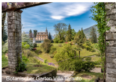
Botanischer Garten Villa Taranto