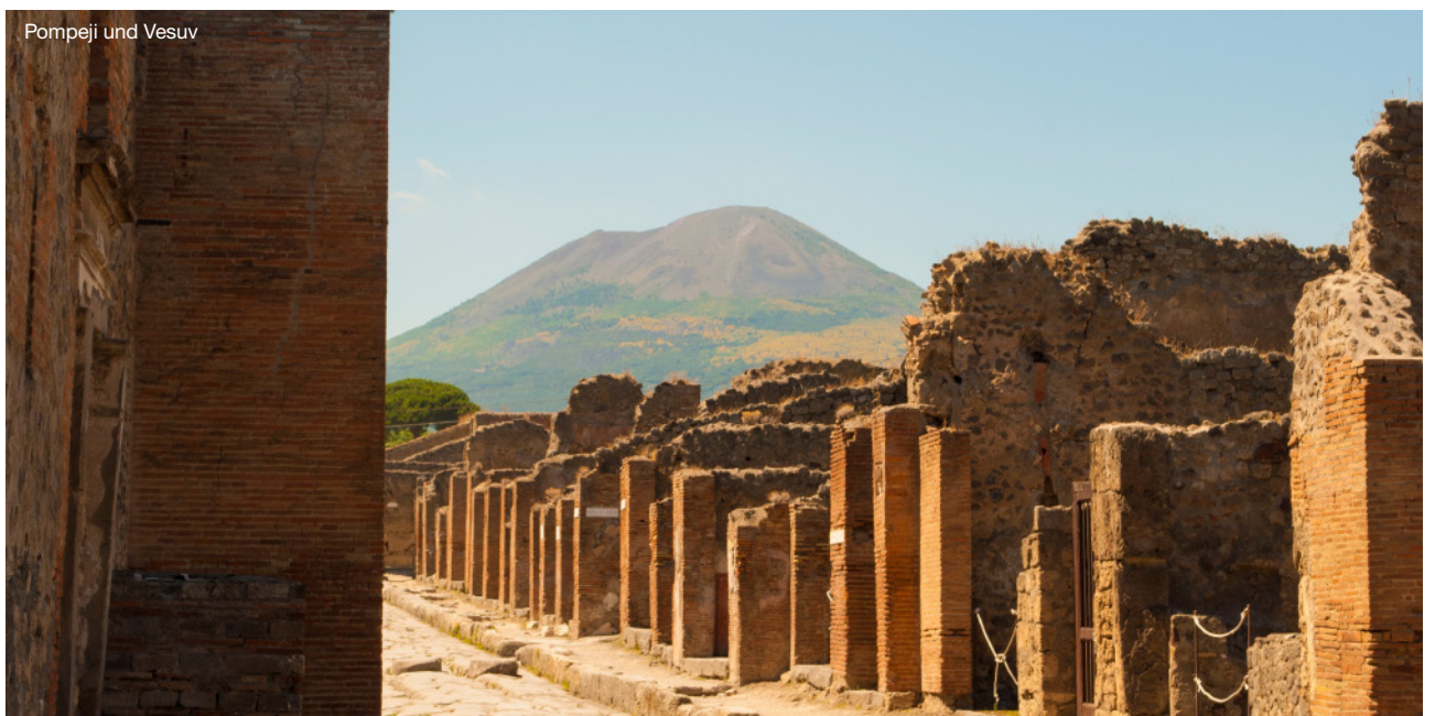
Pompeji und Vesuv

Heute fahren Sie über eine der schönsten Küstenstraßen der Welt. Sie schlängelt sich über Positano nach Amalfi an steilen Felswänden entlang und gewährt immer wieder wunderbare Aussicht auf das tiefblaue Meer. Amalfi ist so eng und steil, dass es nur über Treppengässchen zu begehen ist. Zu den Hauptattraktionen gehören der Dom, Campanile und der „Paradies-Kreuzgang“. Am Nachmittag geht es weiter in das kleine Berg-