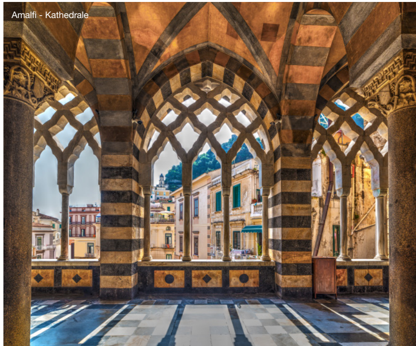
Amalfi - Kathedrale

dorf Ravello, das sich über die Amalfiküste erhebt. In diesem malerischen Ort befinden sich zauberhafte Gärten und sehr viele Künstler haben hier eine Quelle der Inspiration gefunden.