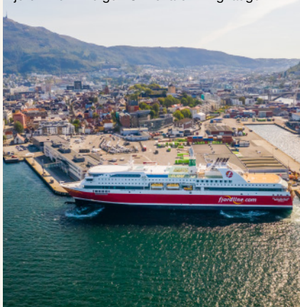
Fjord Line in Bergen