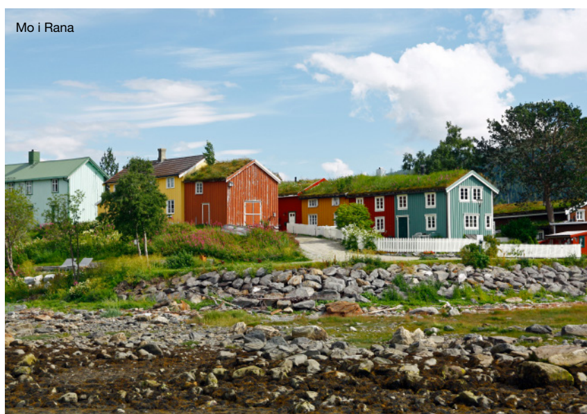
Mo i Rana