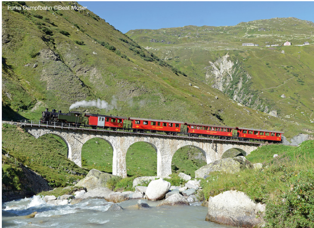
Furka Dampfbahn

Es ist so weit, die historische Eisenbahnstrecke über die Furka ist wieder durchgehend befahrbar. Mit der Wiedereröffnung des letzten Abschnitts zwischen Gletsch und Oberwald am 12. August 2010, rollen die Reisezüge der Dampfbahn Furka-Bergstrecke erstmals seit mehr als einem Vierteljahrhundert. Großzügige Spenden von Freunden und Gönnern ermöglichten es, dem Reisenden wieder das einmalige Erlebnis einer Bahnfahrt über die kontinentale Wasserscheide und entlang des Rhonegletschers zu bieten.