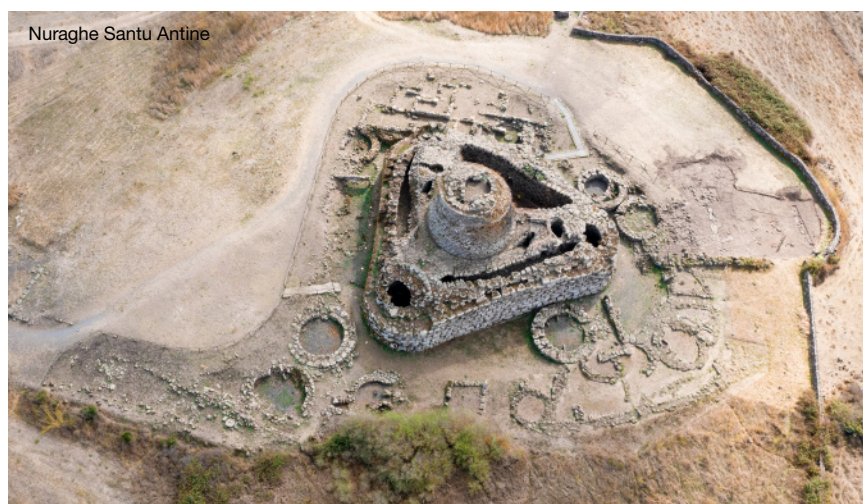
Nuraghe Santu Antine

ziengang durch die engen Gässchen entdecken Sie wunderschöne, handgefertigte Filetstickereien, die noch heute von den einheimischen Dorfbewohnern gefertigt werden. Wenn Zeit bleibt, verkosten Sie noch den für hier typischen Malvasia Wein. Danach geht es weiter in den Nachbarort Tinnura. Dort besichtigen Sie die künstlerischen Wandmalereien, die das ursprüngliche Leben der Bevölkerung auf faszinierende Art und Weise do-